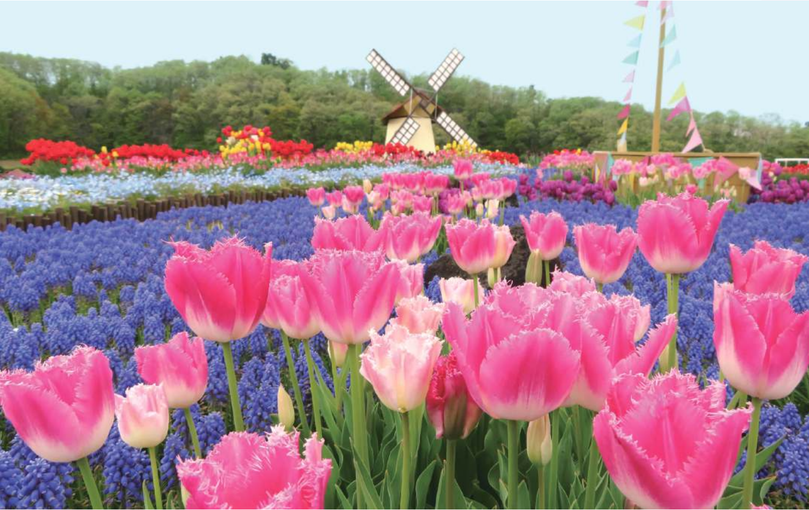
国営越後丘陵公園(長岡市)