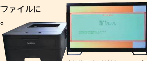
(自動再来受付機 イメージ図)