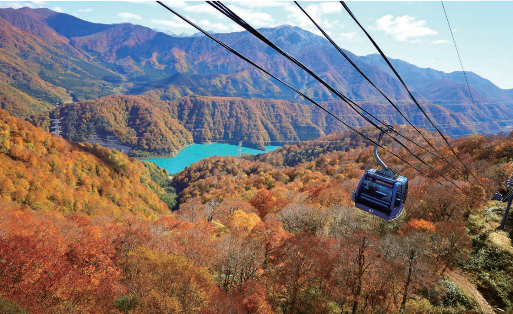
苗場ドラゴンドラと二居湖(南魚沼郡湯沢町)