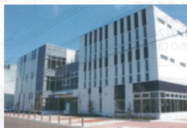
◎交通 新津駅東口向かい徒歩1分